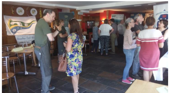
Digwyddiad arddangos yn yr Wynnstey 06/2018

Roedd y broses ymgysylltu'n golygu cysylltiadau un-i-un drwy e-bost, ffôn ac wyneb yn wyneb. Roedd hyn yn cynnwys dau ddiwrnod o fynd i gaffis a bwytai yn Aberystwyth gan siarad â'r perchnogion, rheolwyr a staff eraill, pwy bynnag oedd ar gael. Cafwyd cyfweiliad â pherchenog y Tŷ Coed.